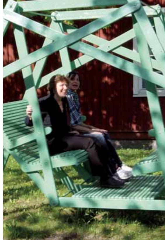
Mit Anregungen, Ideen und Reflexion lässt sich die Entwicklung des Schulwesens „schaukeln“.