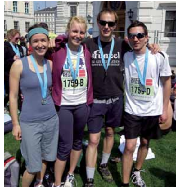
Am 17. April 2011 fand der Vienna City Marathon statt, an dem natürlich auch die sportlichen Agrar- und UmweltpädagogInnen nicht fehlen durften.